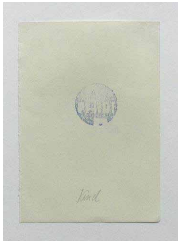
Iris Häussler Ohne Titel, 1994 Bleistift (und Stempelfarbe) auf Papier, signiert 2 verschiedene Zeichnungen je 14,7 x 10,3 cm (gerahmt) Preis: je € 350,-