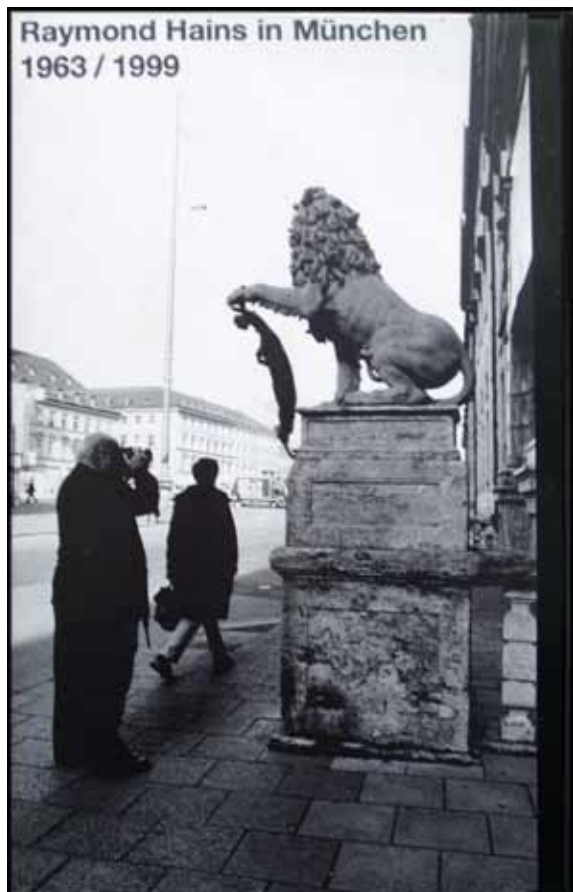
Raymond Hains Raymond Hains in München, 1963/1999 VHS, Farbfilm im Schubert 23''26' Preis: € 49,-