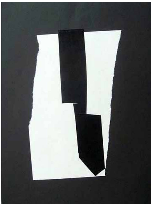
Joseph Egan Ohne Titel, 1981 Collagen, verschiedene Papiere, signiert 21 verschiedene Collagen ca. Din A4 Preis: je € 180,-