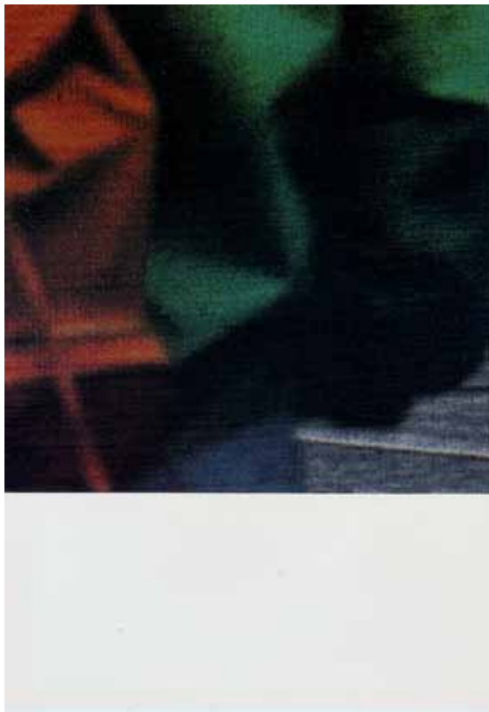
Readymades belong to everyone Postkarten, 1992 Preis: € 2,50