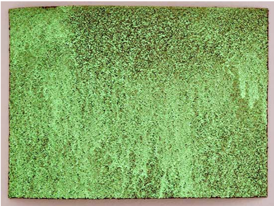
Christina Kubisch Ohne Titel, 1989 Leuchtpigmente auf Schleifpapier, signiert Verschiedene Originale 33 x 45 cm Preis: je € 325,-