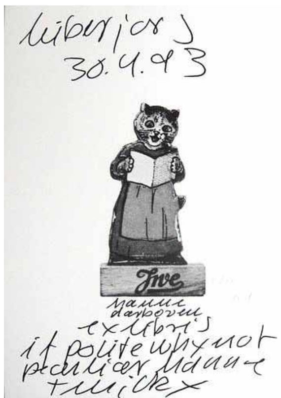
Hanne Darboven if polite why not peculiar, 1993 Offsetdruck, signiert, nummeriert 59,5 x 41,8 cm Auflage 20 Preis: € 225,-