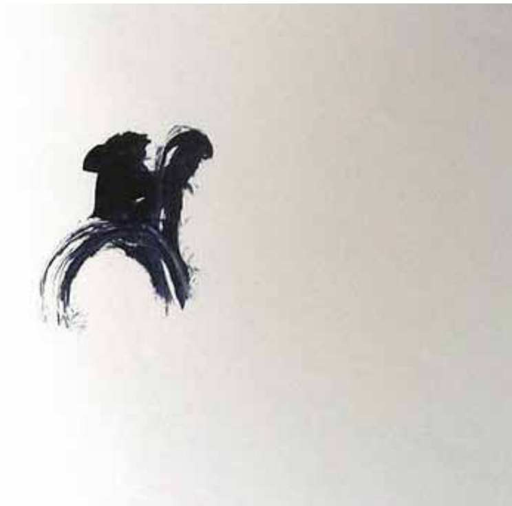
Klaus Kumrow Blau, ohne Datierung Aquarell auf Papier 5 verschiedene Zeichnungen ca. Din A4 Preis: je € 350,-