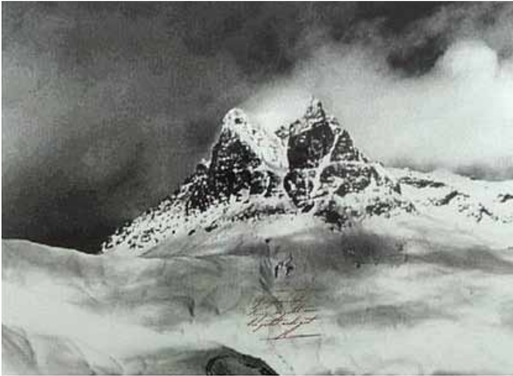
Stephan Huber Tautologisches Konstrukt, 1993 Fotografie und Siebdruck, nummeriert, signiert 42 x 55,5 cm Auflage 12 + III Preis: € 750,- (gerahmt)