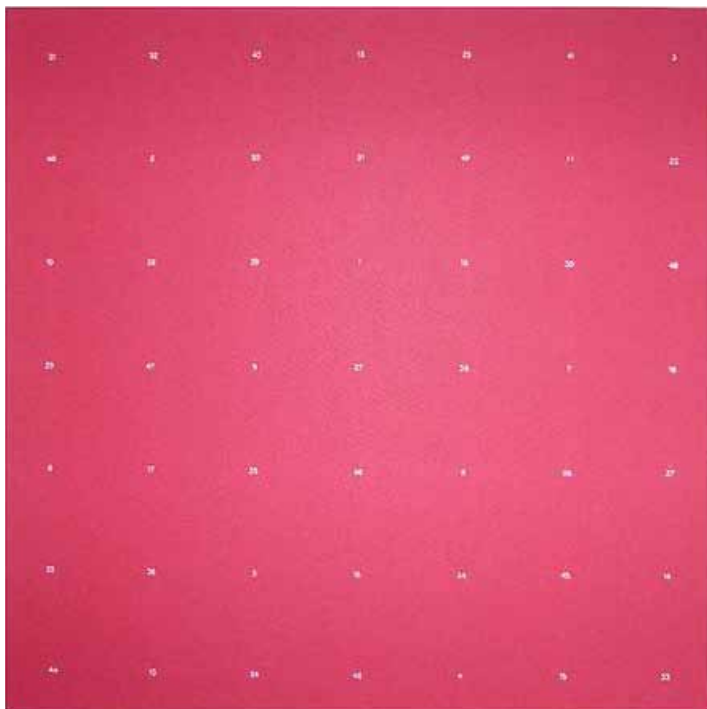
Detlef Halfa Zahlenplan, 1981 Weiße Zahlen auf farbigem Karton, verschiedenfarbige Blätter, signierte Zertifikate 35 x 35 cm Preis: je € 125,-