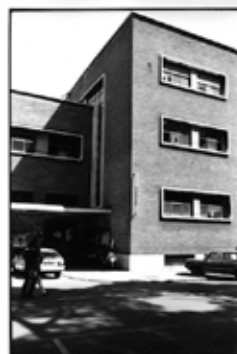
Günter Förg Ohne Titel, 1993 Mappe mit 4 S/W-Fotografien je 18,4 x 27,5 cm Auflage 20 Preis: € 800,- (zusammen) / € 250,- (einzeln)