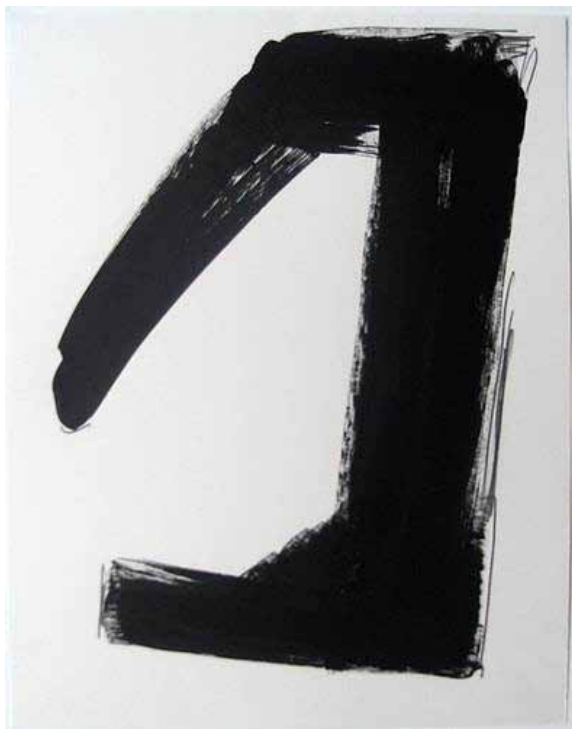
Jaroslav Adler Ohne Titel, 1979 Tusche und Bleistift auf Papier, signiert 16 verschiedene Zeichnungen 29,7 x 21 cm / ca. 35 x 27 cm Preis: je € 250,- / € 300,-